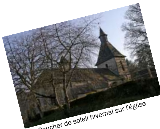
Coucher de soleil hivernal sur l'église