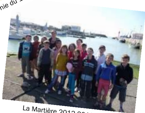
La Martière 2012-2013