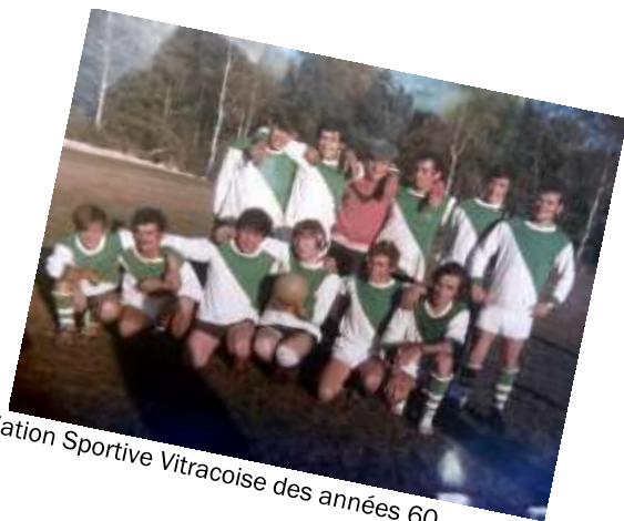
Association Sportive Vitracoise des années 60