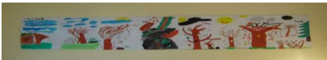
Oeuvre de l'atelier créatif