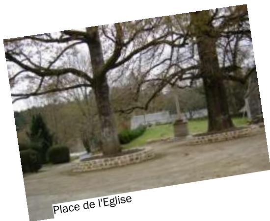
Place de l'Eglise